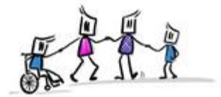
DARE Leitfaden für Inklusion